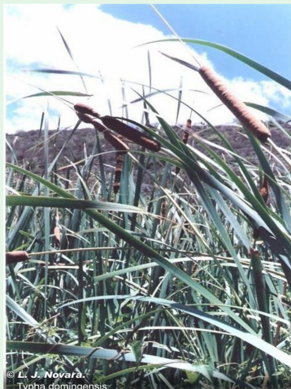
Typha domingensis